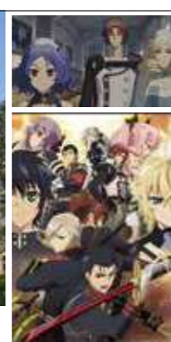
「終わりのセラフ 名古屋決戦編」1~4巻 Blu-ray 6500円+税 NBCユニバーサル・エンターテイメント ©鏡貴也・山本マユト・降矢大輔 / 集英社・終わりのセラフ製作委員会